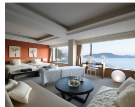
ミキモト コンセプトルーム パール・スイート (56㎡) 最大宿泊人数:2名