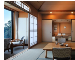
タタミルーム (66㎡) 最大宿泊人数:7名

※ ホームページ内の「客室」のページにて、各お部屋の特徴などを写真とともにご案内しておりますので、お部屋をお選びいただく際に、是非ご参考下さい。