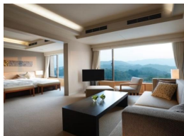
レギュラー・スイート (56㎡) 最大宿泊人数:4名