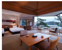
ハーバービュー・ ツイン & タタミ (60㎡) 最大宿泊人数:5名