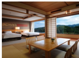
ツイン & タタミ (56㎡) 最大宿泊人数:5名