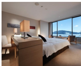
ハーバービュー・ツイン (33㎡) 最大宿泊人数:3名

フロント・レストランがあるオーシャンウイングから連絡通路(途中階段あり)を通ってのご移動が必要です。