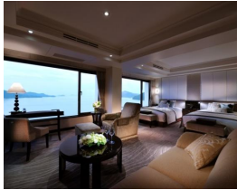
オーシャンビュー・ インペリアル・スイート (56㎡) 最大宿泊人数:2名

玄関・フロント・レストラン・バー・カフェラウンジ・ショップ・スパがあるメインの建物です。