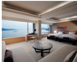
オーシャンビュー・ スイート (56㎡) 最大宿泊人数:3名